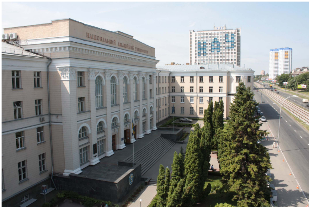
Главный корпус Национального авиационного университета